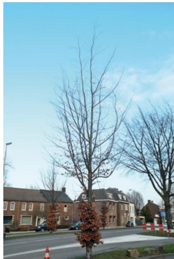
Ilustracja 7a + b: Przykład sytuacji przed i po „cięciu towarzyszącym” młodego drzewa ulicznego ( Fagus sylvatica ). Gruby konar, stanowiący w tej sytuacji konkurencję dla pędu głównego, został usunięty w pierwszej kolejności. Następnie usunięto jeszcze dwa konary