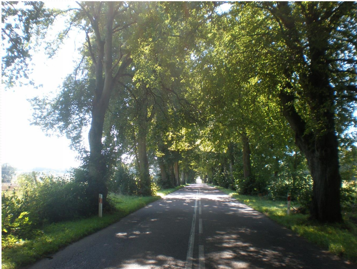
Foto 70 St. Sommerlinden