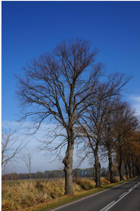
Woiwodschaftsstraße Nr. 122 Lindenallee bei MECHOWO